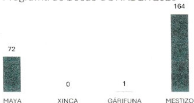
Participación por Grupo Étnico en el Programa de Becas CONADER 2025

La gráfica anterior muestra cuantos alumnos hay por grupo étnico participando en el programa de becas CONADER